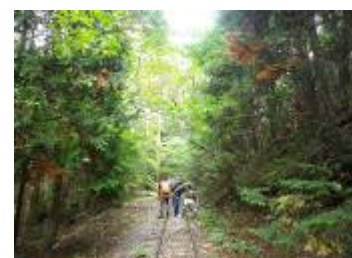
第3回研修会(10/3) 赤沢自然休養林より。