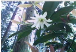
向井 F1の森にたくさん生えています。

高さ:2~5メートル 葉:長楕円形・互生 花:白・3~4月 特徴:枝や葉に香りがあり「抹香臭い」という言葉の語源。供花。 全草にアニサチンなどの有毒成分が含まれる。そのため「悪しき実」とされ、名前のいわれになっている。