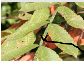
(一部)会員は葉軸の翼を「エンガワ」と呼びなっています。

葉:葉軸に翼がある 花:8月~9月・円錐状に黄白色の小さな花 特徴:葉に虫が寄生すると虫嬰(ちゅうえい)ができる。タンニンを多く含むため昔はお歯黒や白髪染めの原料として利用された。ふつうは被れないが、虫嬰を触ると被れる人もある。