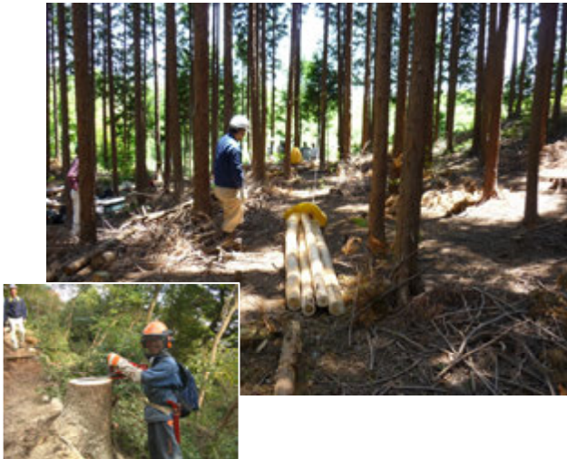
まちのきこり人育成 コース