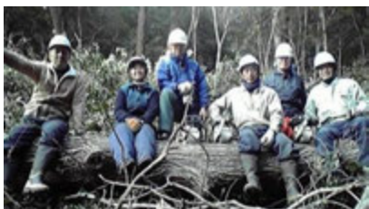
直径55cmのコナラの大木を伐倒