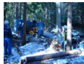
ウインチを使って