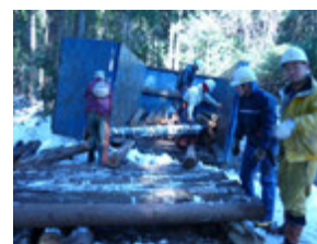
手作業による積み込み

第1・第3土曜日 矢の峰 / 第1・第3日曜日 向井F1 / 第2・第4日曜日 みえぎん まなびの森